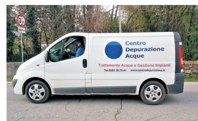
Prodotti chimici per piscina