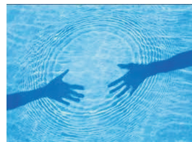
Controlli acqua di piscina

In caso di richiesta i nostri tecnici sono preparati per effettuare interventi tecnici di manutenzione straordinaria della piscina previa offerta scritta del nostro ufficio.